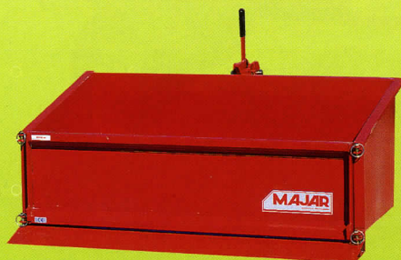
BA100 RENFORCÉE MONOBLOC À RABOT