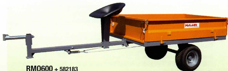
RM0600 + 582183