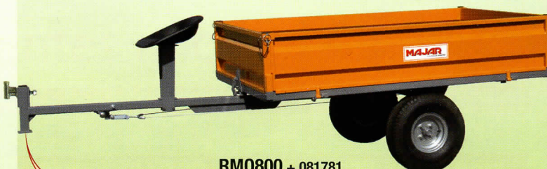
RM0800 + 081781