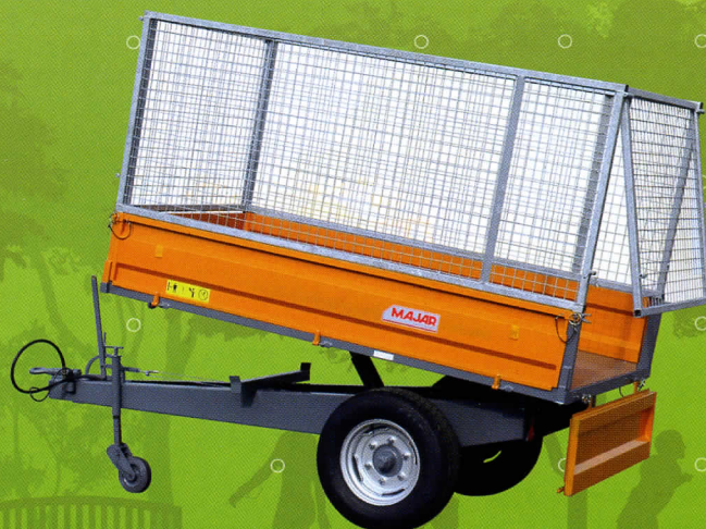
RMTB1425M + RGM1025