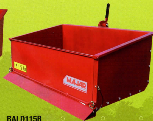
BALD115R DÉMONTABLE À RABOT