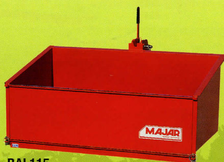
BAL115 LÉGÈRE MONOBLOC