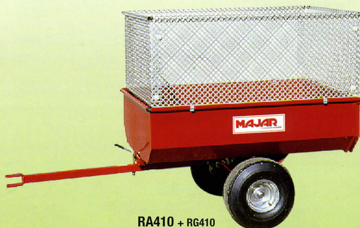
RA410 + RG410