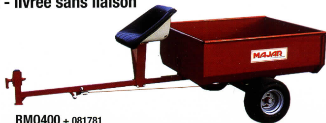
RM0400 + 081781