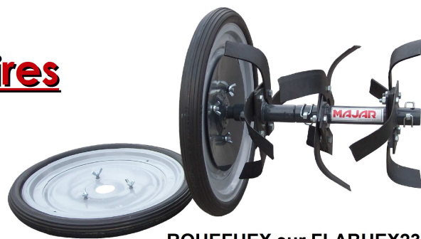
ROUEFHEX sur FLABHEX23

Jeux de fraises avec disques protège plan amovibles livrés de série avec moyeux pour sorties HEX23.